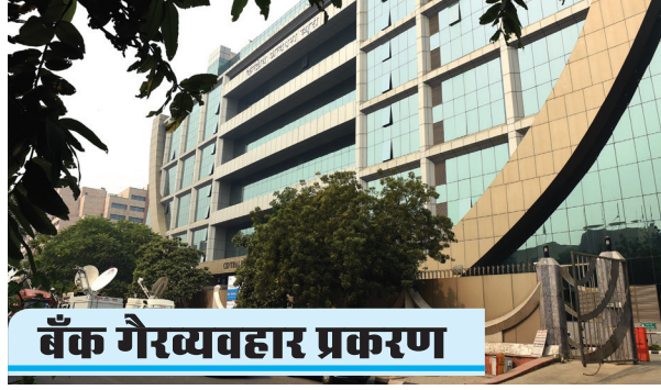
बँक गैरव्यवहार प्रकरण

■ १९०हून अधिक ठिकाणी कारवाई ■ ३५ बँकांशी संबंधित गुन्हे ■ ४२ नव्या गुन्हांचाही समावेश